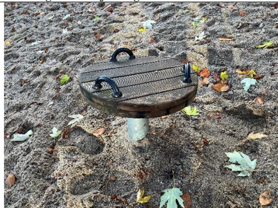
Redskab: karrusel Årgang: Producent: Er redskabet mærket: Nej Er der registreret fejl/mangler: Ja