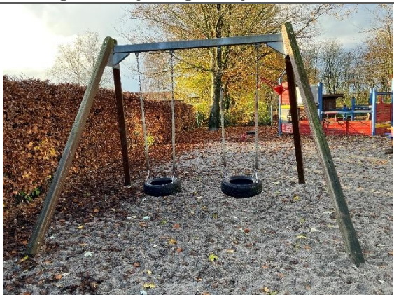
Redskab: Gyngestativ Årgang: 2013 Producent: Eibe Er redskabet mærket: Ja Er der registreret fejl/mangler: Ja