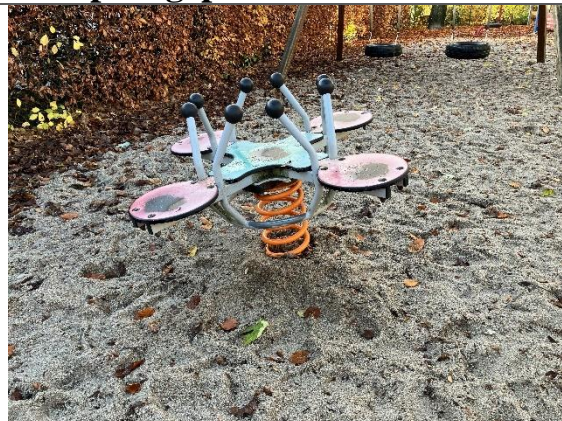
Redskab: Vippedyr Årgang: Producent: Er redskabet mærket: Nej Er der registreret fejl/mangler: Ja