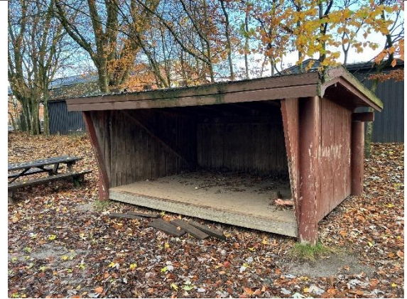
Redskab: Shelter Ikke omfattet af DS/EN 1176