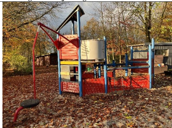
Redskab: Legetårn Årgang: Producent: Hags Er redskabet mærket: Nej Er der registreret fejl/mangler: Ja