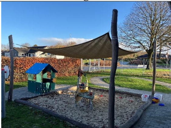
Redskab: Sandkasse med solsejls stolper Årgang: 2023 Producent: Kompan Er redskabet mærket: Ja Er der registreret fejl/mangler: Nej