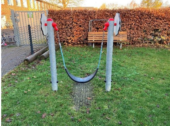
Redskab: Mavegyngte Årgang: 2023 Producent: Kompan Er redskabet mærket: Ja Er der registreret fejl/mangler: Nej