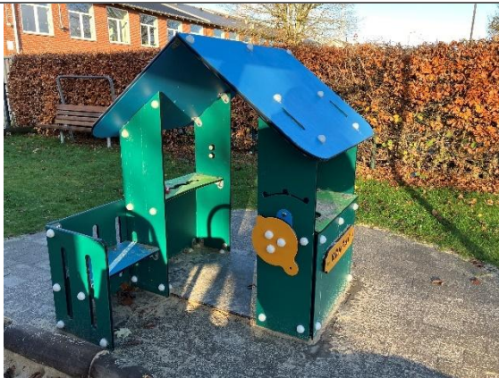
Redskab: Legehus Årgang: 2023 Producent: Kompan Er redskabet mærket: Ja Er der registreret fejl/mangler: Nej