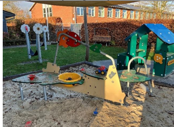
Redskab: Sandleg Årgang: 2023 Producent: Kompan Er redskabet mærket: Ja Er der registreret fejl/mangler: Nej