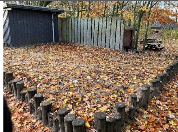
Redskab: Sandkasse Årgang: Producent: Er redskabet mærket: Ja men ulæselig Er der registreret fejl/mangler: Nej