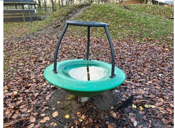
Redskab: Karrusel Årgang: 2022 Producent: Kompan Er redskabet mærket: Ja Er der registreret fejl/mangler: Ja