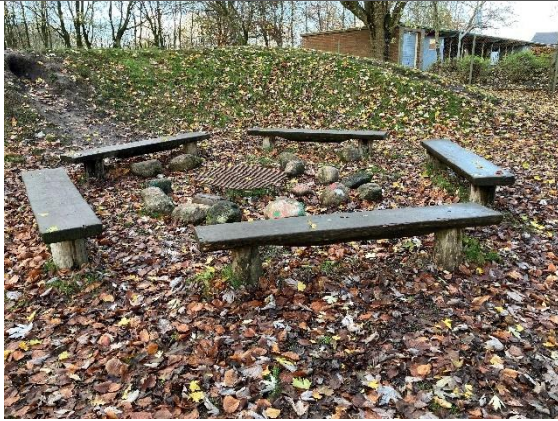
Redskab: Båsted Ikke omfattet af DS/EN 1176