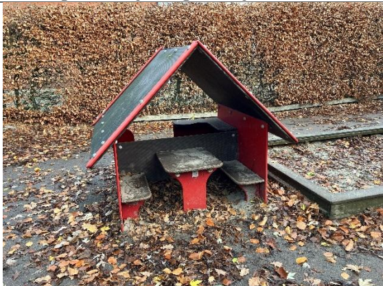
Redskab: Legehus Årgang: Producent: Er redskabet mærket: Nej Er der registreret fejl/mangler: Ja