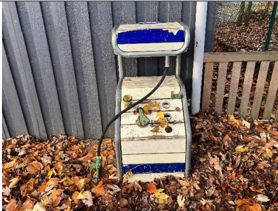
Redskab: Lege tank stander Årgang: Producent: Er redskabet mærket: Nej Er der registreret fejl/mangler: Nej