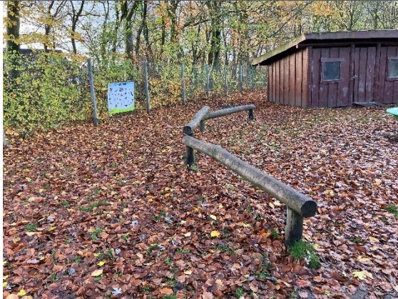
Redskab: Balancebom Årgang: 2022 Producent: Kompan Er redskabet mærket: Ja Er der registreret fejl/mangler: Nej