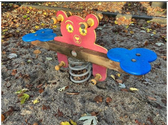
Redskab: Vippedyr Årgang: 2013 Producent: Eibe Er redskabet mærket: Ja Er der registreret fejl/mangler: Ja