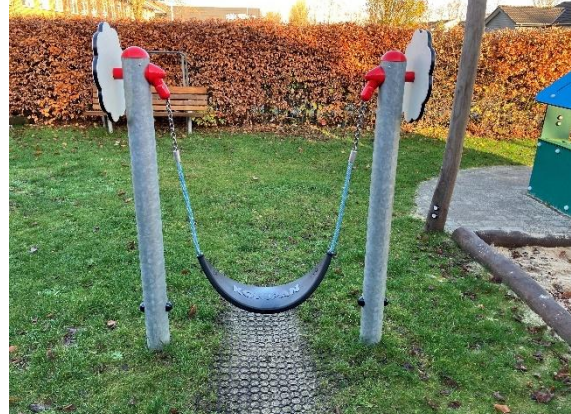
Redskab: Mavegyngte Årgang: 2023 Producent: Kompan Er redskabet mærket: Ja Er der registreret fejl/mangler: Nej