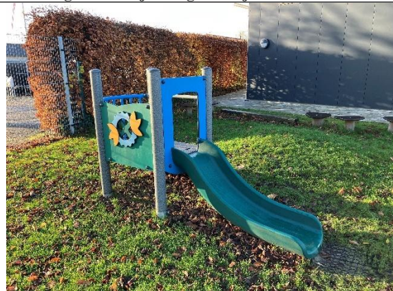
Redskab: Legetårn Årgang: 2023 Producent: Kompan Er redskabet mærket: Ja Er der registreret fejl/mangler: Nej