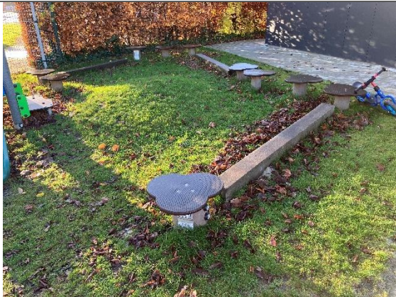
Redskab: Balance leg Årgang: 2023 Producent: Kompan Er redskabet mærket: Ja Er der registreret fejl/mangler: Nej