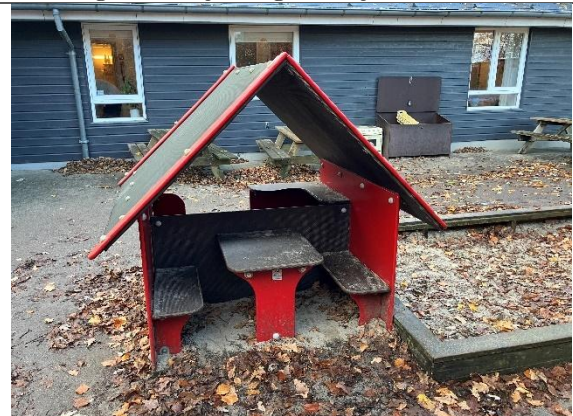
Redskab: Legehus Årgang: Producent: Er redskabet mærket: Nej Er der registreret fejl/mangler: Ja